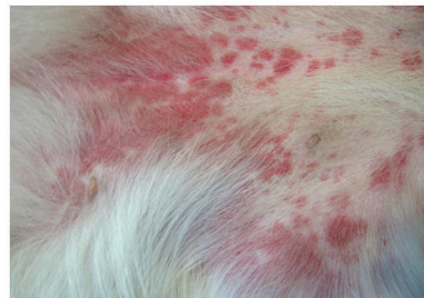
Aufgepasst, was verfüttert wird! Hier eine heftige allergische Reaktion auf „Leckerchen“ - in diesem Fall waren es Schweineohren.

Fazit: "Nur die richtige Fütterung ist die beste Voraussetzung für einen gesunden Vierbeiner!"